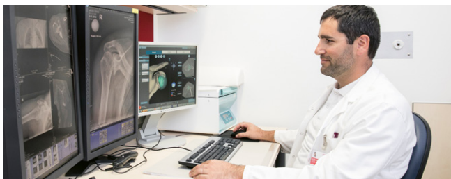
Im Vorfeld einer Schulter-OP wird der Einsatz einer Prothese mittels 3D-Simulationssoftware genau vorbereitet.

Im Herz-Jesu Krankenhaus hat die II. Orthopädische Abteilung die führende Rolle bei der gelenkerhaltenden und endoprothetischen Chirurgie an Hand, Schulter und Ellbogen (obere Extremität). Darüber hinaus werden Eingriffe an Hüfte und Knie auf höchstem Niveau durchgeführt. Die Spezialisten der Abteilung zählen zu den führenden Expertinnen und Experten in diesen Bereichen. Die II. Orthopädie verfügt mit dem Gütesiegel endoCert® über hohe Expertise in Hüft- und Kniegelenkersatz sowie Schultergelenkersatz.