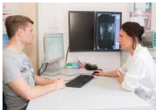
In der Ambulanz werden Befunde und weitere Diagnoseschritte besprochen.

Die Osteologie legt ihren Fokus auf die menschlichen Knochen bzw. auf das gesamte Skelettsystem. Das Team ist dabei auf die Behandlung von Osteoporose (Knochenschwund) spezialisiert. Die rechtzeitige Erkennung und Therapie dieser Erkrankung hat hier oberste Priorität. Die Osteoporose macht, aufgrund der abnehmenden Knochendichte, den Knochen