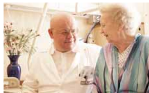
Im persönlichen Gespräch wird das individuelle Rehabilitationsziel gemeinsam definiert.

Seit über 15 Jahren gibt es im Herz-Jesu Krankenhaus ein Department für Akutgeriatrie und Remobilisation (AG/R). Hier betreut das AG/R-Team Patienten fortgeschrittenen Alters, denen nach einer akuten Erkrankung oder Operation die Pflegebedürftigkeit droht bzw. bei denen die Pflegebedürftigkeit bereits eingetreten ist. Das Team wird von Fachärzten für Innere Medizin und Geriatrie geleitet. Zusätzlich setzt sich das Behandlungsteam aus Fachärzten für Orthopädie, Mitarbeitern der Pflege, der klinischen Psychologie, der Diätologie, dem Entlassungsmanagement sowie Physio- und Ergotherapeuten zusammen. Das Ziel ist die Rückführung zur größtmöglichen Selbstständigkeit in einen selbstbestimmten Alltag.