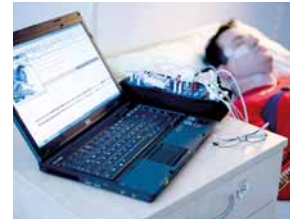
Modernste Technik überwacht den Patienten im Schlaflabor.

In Wiens größtem Schlaflabor, von einer unabhängigen Kommission mit der Bestnote ausgezeichnet, werden schlafstörende Ereignisse diagnostiziert und individuelle Therapien erstellt. Das Team ist dabei auf die Diagnose und Behandlung von Schlafapnoe (Atemaussetzern im Schlaf) spezialisiert. Das Leistungsspektrum umfasst die Polysomnographie (umfassende Untersuchung während des Schlafs), Einstellung auf patientenbedienbare Atemhilfen und umfangreiche lungenfachärztliche Diagnostik.