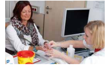
Die Blutzuckermessung ist eine der Untersuchungen zur Bestimmung von Diabetes.

Den Fokus legt das Team auf die frühzeitige Erkennung dieser Stoffwechselerkrankung. Die Patienten werden dabei stationär und ambulant betreut. Die Behandlung umfasst die Therapie mit Tabletten, die Einstellung auf die individuell angepasste Insulinabgabe und gegebenenfalls eine Umstellung von Ernährung und Lebensstil. Wichtig ist dabei eine umfassende Patientenschulung, die im Haus angeboten wird.