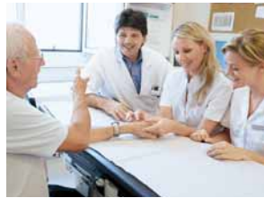
Ärzte und Patient besprechen gemeinsam die Behandlungsschritte.

Das Team behandelt entzündliche, rheumatische Erkrankungen, Kollagenosen (Bindegewebserkrankungen) und andere Autoimmun-Erkrankungen. Auf arthrotische Erkrankungen der großen, tragenden Gelenke, der Wirbelsäule sowie der kleinen Gelenke wird besonderes Augenmerk gelegt. Neben den etablierten rheumatologischen Standardtherapien bietet die Abteilung neue, innovative Therapien (Biologika) unter stationärer Überwachung an. Interdisziplinär arbeiten Internisten und Orthopäden zusammen und bieten dadurch schnellere Diagnostik und effizientere medikamentöse oder (bei Bedarf) orthopädisch-chirurgische Behandlung.