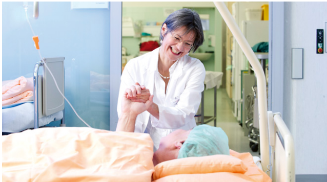
In der Fachklinik für Bewegung steht der Mensch im Mittelpunkt.