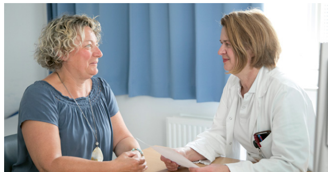
Ärztin und Patientin besprechen gemeinsam die Behandlung.

Das Herz-Jesu Krankenhaus ist eines von sieben Ordenskrankenhäusern der Vinzenz Gruppe, das christliche Werte und hohe medizinische Kompetenz miteinander verbindet. Hier stehen die Patientinnen* und Patienten* im Zentrum des Geschehens, von der Aufnahme bis zur Entlassung. Dadurch bietet die Klinik eine ganzheitliche Versorgung vor, während und nach dem Krankenhausaufenthalt. Menschliche Zuwendung, Verständnis und Geduld für Patientinnen*