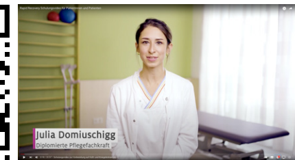
Rasche Genesung mit Rapid Recovery nach einem Gelenksersatz. Scannen Sie den QR-Code, um im Video alles darüber zu erfahren.