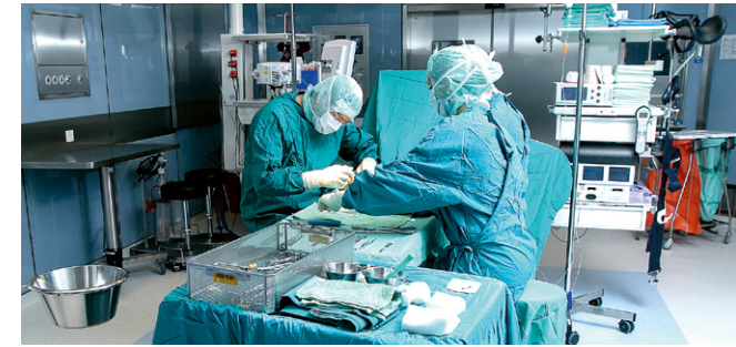
Die Klinik verfügt über fünf Operationssäle zur Behandlung von Gelenksproblemen, zwei davon in einer hochmodernen Tagesklinik.

In der Tagesklinik können ausgewählte Operationen ohne Übernachtung im Krankenhaus angeboten werden. Nach der Operation an Hand, Fuß, Knie oder Schulter geht der Patient am Abend des gleichen Tages wieder nach Hause – individueller Nachbetreuungsplan inklusive. Auch bei Operationen wie dem Einsatz von Knie- oder Hüftendo-