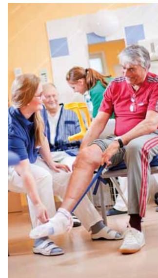
Fit nach der Gelenks-OP: Mit „Rapid Recovery“ sind Sie schneller und zufriedener wieder zu Hause.

Regelmäßig unterzieht sich das Herz-Jesu Krankenhaus Zertifizierungen nach internationalen Standards. Nach den Zertifizierungen nach pCC inklusive KTQ in den Jahren 2010 und 2014 stellte sich die Klinik im Frühjahr 2017 der Zertifizierung nach ISO 9001:2015 inkl. pCC. Auch im Bereich der Mitarbeiterorientierung ist das Herz-Jesu Krankenhaus seit 2016 nach dem Audit berufundfamilie zertifiziert.