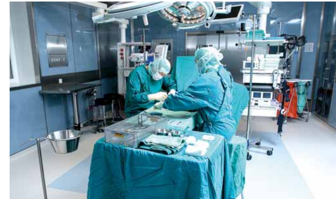
Die Klinik verfügt über fünf Operationssäle zur Behandlung von Gelenkproblemen, zwei davon in einer hochmodernen Tagesklinik.

In der 2016 neu eröffneten Tagesklinik können ausgewählte Operationen ohne Übernachtung im Krankenhaus angeboten werden. Nach der morgendlichen Operation an Hand, Fuß, Knie oder Schulter geht der Patient am Abend des gleichen Tages wieder nach Hause – individueller Nachbetreuungsplan inklusive. Auch bei Operationen wie dem