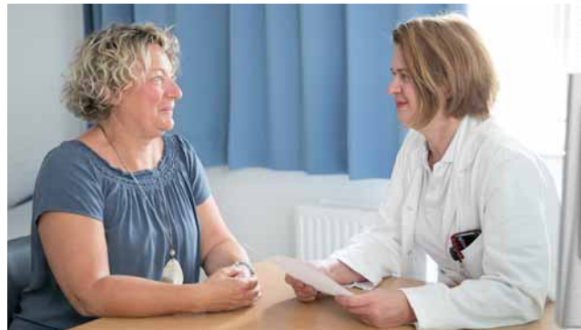
Ärztin und Patientin besprechen gemeinsam die Behandlung.

Das Herz-Jesu Krankenhaus ist eines von sieben Ordenskrankenhäusern der Vinzenz Gruppe, das christliche Werte und hohe medizinische Kompetenz miteinander verbindet. Hier stehen die Patienten im Zentrum des Geschehens, von der Aufnahme bis zur Entlassung. Dadurch bietet die Klinik eine ganzheitliche Versorgung vor, während und nach dem Krankenhausaufenthalt. Menschliche Zuwendung, Verständnis und Geduld für Patienten und ihre Angehörigen sind