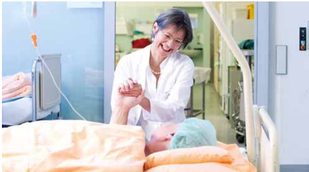
In der Fachklinik für den Bewegungsapparat steht der Mensch im Mittelpunkt.