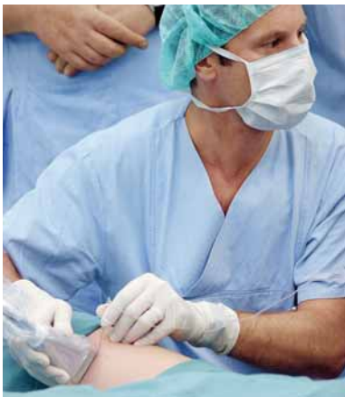
Dank Ultraschall umspült der Anästhesist den Nerv ganz gezielt mit dem Betäubungsmittel.

Pro Jahr werden an unserer Abteilung rund 3.800 Ultraschall-gezielte Nervenblockaden durchgeführt. Dabei handelt es sich um eine Spezialtechnik der Regionalanästhesie und Schmerztherapie. Sie ist eine der wichtigsten Innovationen der Anästhesie der letzten Jahre. Der wesentliche Vorteil dieser Technik besteht darin, dass Nerven mit Hilfe moderner Ultraschallgeräte aufgespürt und dargestellt werden. Dadurch können die Nerven unter direkter Sicht gezielt mit dem Betäubungsmittel umspült werden, wo man zuvor nur „blind“ umspritzen konnte.