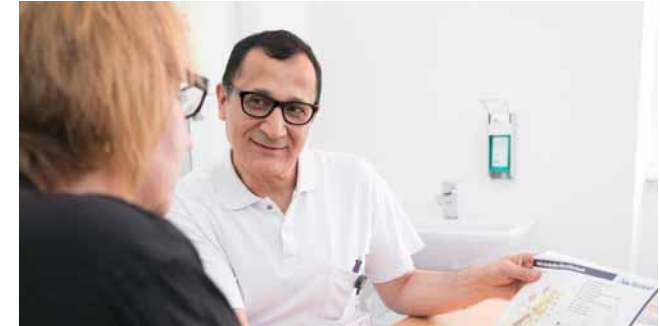
In der OPV (Operativen Vorbereitung) werden Sie auf Ihre Operation bestens vorbereitet.

Sie müssen unbedingt nüchtern sein, das heißt, bis 6 Stunden vor der Anästhesie dürfen Sie essen, bis 2 Stunden davor auch unbeschränkt Wasser oder klare Flüssigkeiten