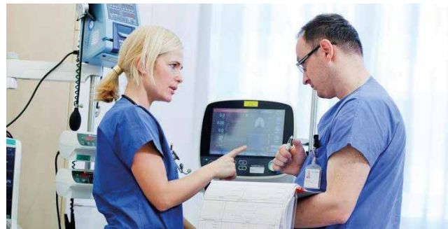
Auf der Intensivstation arbeiten Ärzte und Pflege zum Wohle der Patienten Hand in Hand.

An der anästhesiologischen Intensivstation (IMCU – Intermediate Care Unit) stehen rund um die Uhr Betten für die