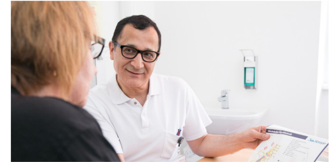
In der OPV (Operationsvorbereitung) werden Sie auf Ihre Operation bestens vorbereitet.

Sie müssen unbedingt nüchtern sein, das heißt, bis 6 Stunden vor der Anästhesie dürfen Sie essen, bis 2 Stunden davor auch unbeschränkt Wasser oder klare Flüssigkeiten