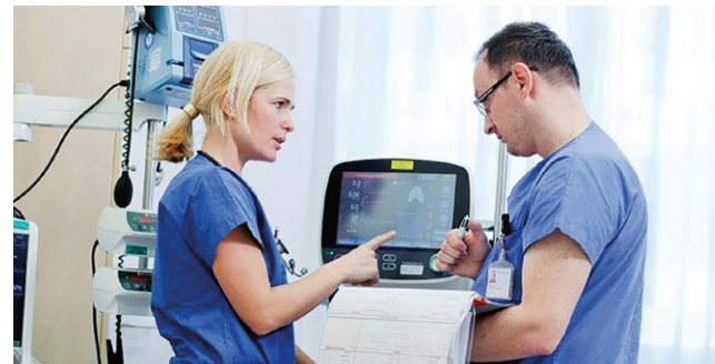
Auf der Intensivstation arbeiten Ärzte und Pflege zum Wohle der Patienten Hand in Hand.

An der anästhesiologischen Intensivstation (IMCU – Intermediate Care Unit) stehen rund um die Uhr Betten für die