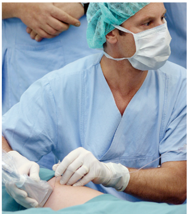
Dank Ultraschall umspült der Anästhesist den Nerv ganz gezielt mit dem Betäubungsmittel.

Pro Jahr werden an unserer Abteilung rund 3.800 Ultraschall-gezielte Nervenblockaden durchgeführt. Dabei handelt es sich um eine Spezialtechnik der Regionalanästhesie und Schmerztherapie. Sie ist eine der wichtigsten Innovationen der Anästhesie der letzten Jahre. Der wesentliche Vorteil dieser Technik besteht darin, dass Nerven mit Hilfe moderner Ultraschallgeräte aufgespürt und dargestellt werden. Dadurch können die Nerven unter direkter Sicht gezielt mit dem Betäubungsmittel umspült werden, wo man zuvor nur „blind“ umspritzen konnte.