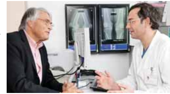
Arzt und Patient besprechen gemeinsam die geplante Operation.

Die Experten behandeln alle schmerzhaften Funktionseinschränkungen von Hüfte und Knie. Dazu zählen altersbedingte, posttraumatische (nach einer Verletzung) und postentzündliche (post-rheumatische) Abnützungen sowie angeborene Fehlstellungen der großen Gelenke. Das Team setzt dabei sowohl auf etablierte Methoden als auch auf modernste Techniken der Implantationschirurgie, wie minimal-invasive Operationsverfahren, Computernavigation und gendergerechte (geschlechterspezifische) Implantate. Eine weitere Besonderheit bildet „Rapid Recovery“. Dieses Behandlungskonzept ermöglicht, in Zusammenarbeit mit den Abteilungen für Physikalische Medizin und Rehabilitation sowie für Anästhesie, Intensivmedizin und Schmerztherapie, eine schnellere und problemlosere Genesung nach Hüft- und Kniegelenksersatzoperationen.