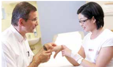
Vor und nach der Operation untersucht der Arzt die Patientin genau.

Die Fußchirurgie bildet einen Schwerpunkt der Abteilung. Das Team befasst sich mit der Behandlung aller angeborenen und erworbenen Fehlstellungen sowie mit Gelenkschäden und Problemen rheumatischer Ursache. Degenerative Probleme im Bereich der Füße mit Ausbildung von Hallux Valgus, Hallux Rigidus und Hammerzehen zählen zu den häufigsten orthopädischen Beschwerden. Neben der routinemäßigen Versorgung dieser Fälle führen die Spezialisten auch komplexe Operationen an Mittel- und Rückfuß sowie Revisionsoperationen nach vorangegangenen Eingriffen durch. Für diese komplexen Operationen ist die Abteilung Anlaufstelle weit über die Grenzen Wiens hinaus.