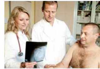
Der Patient wird von Orthopäden und Internisten versorgt.

In fortgeschrittenen Stadien rheumatologischer Erkrankungen kann eine Verbesserung der Beschwerden oft durch orthopädisch-chirurgische Maßnahmen erreicht werden. Die Erfahrung der Spezialisten auf den Gebieten der Hand- und Fußchirurgie sowie des künstlichen Gelenksersatzes fließt in die Behandlung mit ein. Durch die intensive Zusammenarbeit zwischen rheumatologisch ausgebildeten Internisten und Orthopäden am Herz-Jesu Krankenhaus ergibt sich für den Patienten der Vorteil einer schnelleren Diagnostik und effizienteren medikamentösen oder orthopädisch-chirurgischen Behandlung.