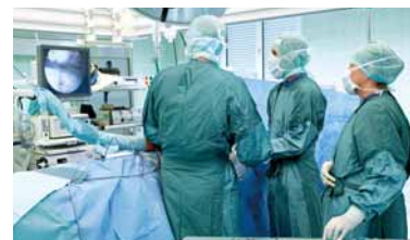
Die schonende Operations-Methode der Arthroskopie ermöglicht raschere Genesung.

Viele Eingriffe an Gelenken können heute mittels arthroskopischer Techniken durchgeführt werden: Durch sehr kleine Schnitte kann die Operation wesentlich schonender ablaufen. Auch die Rehabilitation erfolgt wesentlich schneller. Schulterschmerzen und Einrisse der Schultermuskulatur können meist arthroskopisch behandelt werden, ebenso wie Probleme an Ellbogen-, Hand- und Fingergelenken. Arthroskopische Operationen am Kniegelenk zur Behandlung von