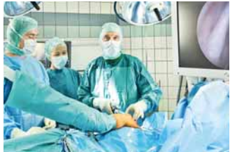
Schonende, arthroskopische Operationsmethoden machen eine rasche Genesung möglich.

Eine Vorreiterrolle nimmt die Abteilung im Besonderen im Bereich der Schulterchirurgie ein: Österreichweit werden an der II. Orthopädischen Abteilung die meisten Schulteroperationen durchgeführt – sowohl im Bereich der gelenkerhaltenden Arthroskopie als auch beim künstlichen Ge-