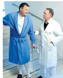
Das Team sorgt für die Patienten vor, während und nach der Operation.

Schwere Abnützungen des Hüftgelenks und deren Folgen werden bereits seit vielen Jahren erfolgreich mit Hüftendoprothesen behandelt. Um das künstliche Gelenk einzubauen, mussten bisher die Muskeln und Sehnenansätze durchtrennt werden. An der II. Orthopädischen Abteilung werden von einem Expertenteam diese Operationen auch minimal-invasiv durchgeführt. Das bedeutet, dass der Schnitt sehr viel kleiner ist, und die Muskeln und Sehnen für den Eingriff auseinander geschoben werden und nicht durchtrennt werden müssen. Dadurch sind die Schmerzen nach der Operation geringer und die späteren Narben deutlich kleiner.