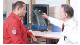
Arzt und Patient besprechen gemeinsam die Operation.

letzungen rasch und unkompliziert abgeklärt und weitere Behandlungsschritte eingeleitet werden. In der Ambulanz werden Gelenksverrenkungen, Band- und Sehnenrisse, Knorpelverletzungen sowie Frakturen behandelt. Offene blutende Wunden sowie Kopf- und Wirbelsäulenverletzungen können nicht behandelt werden.