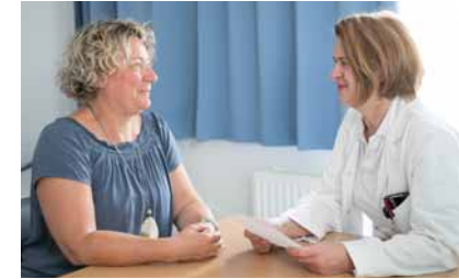
Die Ärztin berät die Patientin über die Behandlungsmöglichkeiten.

Die Qualitätsstandards von endoCert® garantieren höchstes Niveau in der Ausbildung der Ärzte und der Behandlung. Zum Behandlungsspektrum gehören alle schmerzhaften