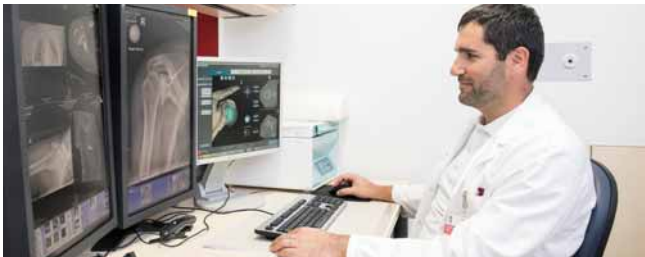
Im Vorfeld einer Schulter-OP wird der Einsatz einer Prothese mittels 3D-Simulationssoftware genau vorbereitet.

Im Herz-Jesu Krankenhaus hat die II. Orthopädische Abteilung die führende Rolle bei der gelenkerhaltenden und endoprothetischen Chirurgie an Hand, Schulter und Ellbogen (obere Extremität). Darüber hinaus werden Eingriffe an Hüfte und Knie auf höchstem Niveau durchgeführt. Die Spezialisten der Abteilung zählen zu den führenden Expertinnen und Experten in diesen Bereichen. Die II. Orthopädie verfügt mit dem Gütesiegel endoCert® über hohe Expertise in Hüft- und Kniegelenkersatz.