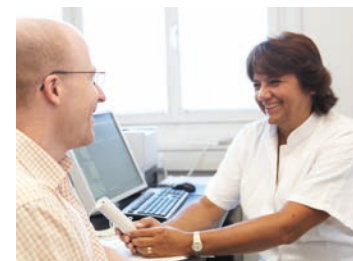
In der Präanästhesie-Ambulanz werden Sie auf Ihre Operation bestens vorbereitet.

An der Abteilung werden alle modernen Verfahren der Schmerztherapie angewandt. So kommen auch Patienten-kontrollierte Schmerzpumpen, Katheterverfahren und Schmerzmedikamente in individuellen Stärken und Verabreichungsformen zum Einsatz. Der diensthabende Anästhesist steht Ihnen als „Akutschmerzdienst“ zusätzlich rund um die Uhr zur Verfügung. Damit kann das Ideal vom schmerzarmen Krankenhaus sehr effizient umgesetzt werden.