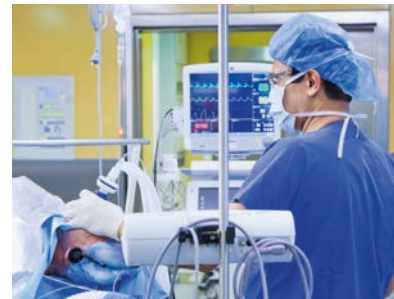
Während der Operation wacht der Anästhesist stets über den Patienten.

Die Intensivstation ist mit neuesten Geräten, unter anderem zur Herz-Kreislauf- und Beatmungstherapie, ausgestattet. Sie wird von speziell intensivmedizinisch qualifizierten Mitarbeitern betreut und entspricht allen Strukturqualitätskriterien für diese Versorgungsstufe. So können auch Risikopatienten nach größeren Operationen optimal betreut und behandelt werden.