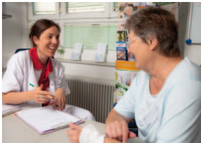
Mit der Aufnahme in unserem Krankenhaus beginnt die Betreuung und Information.

Die medizinische und pflegerische Betreuung im Krankenhaus kann nur dann zum Erfolg führen, wenn diese auch nach der stationären Behandlung zuhause durch Vertrauenspersonen, Familie oder extramurale Dienste (Hauskrankenpflege, Heimhilfe, Essen auf Räder und viele mehr) adäquat weitergeführt werden kann.