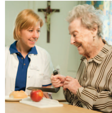
Damit Sie auch nach Ihrem Aufenthalt in Ihrer gewohnten Umgebung wieder zurechtkommen: Das Herz-Jesu Krankenhaus unterstützt Sie dabei.