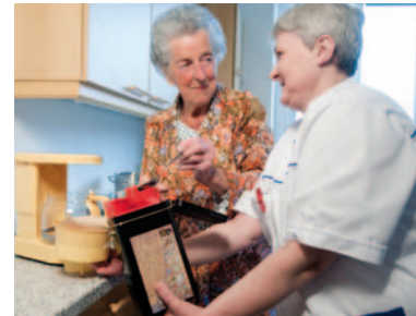
Unser Entlassungsmanagement-Team erstellt gemeinsam mit Ihnen ein persönliches Betreuungskonzept.

Sie stehen im Mittelpunkt unserer Tätigkeit. Wenn Ihre Behandlung nach Ihrem Aufenthalt im Krankenhaus zuhause noch weitergeführt wird, ist es besonders wichtig, dass Sie selbst die Form Ihrer Weiterbetreuung bestimmen und wir gemeinsam die zukünftigen Schritte festlegen.